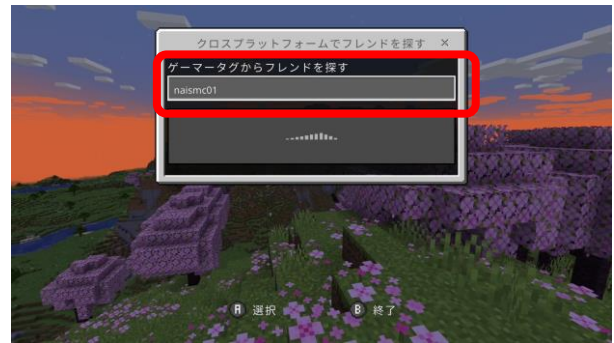
② フレンド名：naismc01 と入力します。