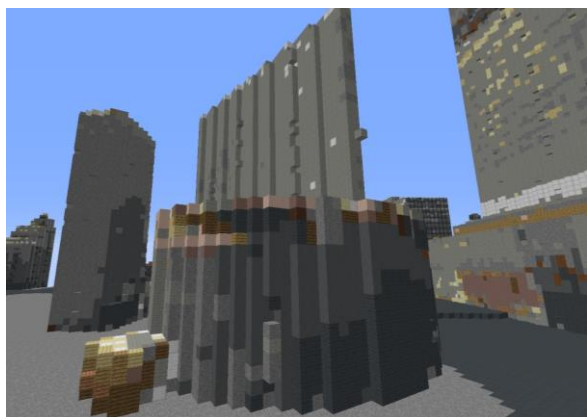
ブラッシュアップ前

ブラッシュアップされたデータは、当社HPより無償提供される予定です。ゲームや教育現場、まちづくりコンテストの開催等々…自由な発想で、ぜひブラッシュアップされた「にいがた2km」データを利用してください！