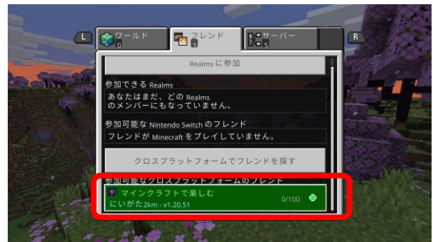
④ しばらく待つと「マイクラフトで楽しむ にいがた2km」が表示されます。「チェックされていません」画面は「続ける」を選択します。