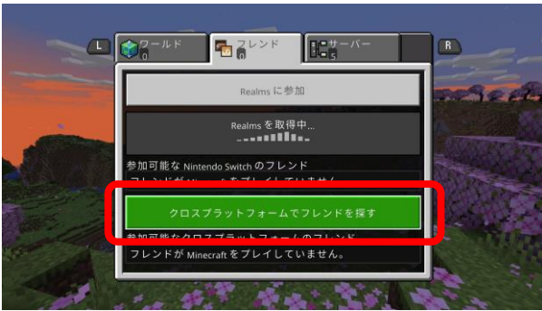
① トップ画面の「プレイ」ボタンを押し、「クロスプラットフォームでフレンドを探す」を選択します。

「フレンドを追加」するには、Xbox liveアカウントの登録およびNintendo Switch Onlineの加入が必要です。